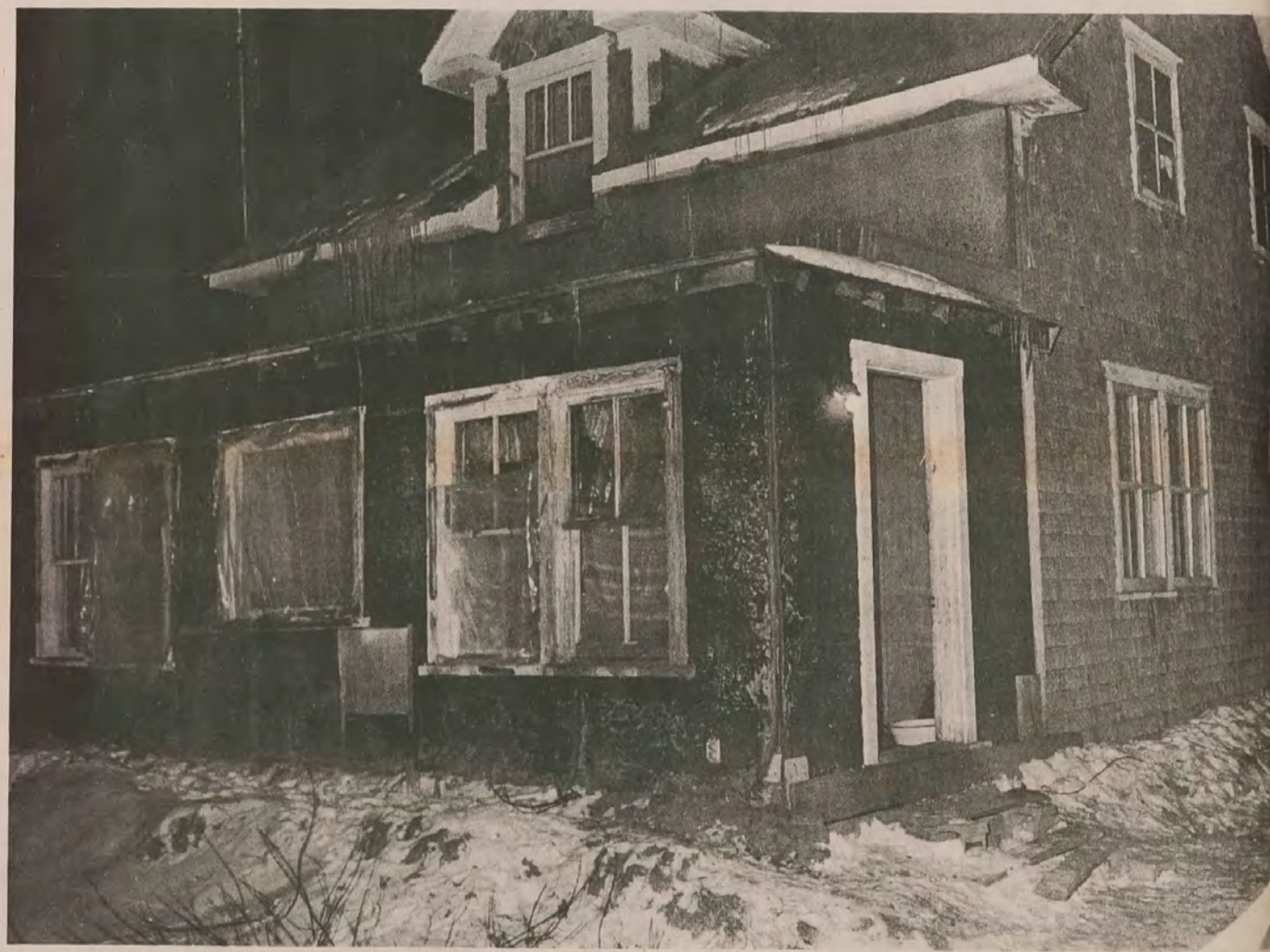
La maison où habite Willie Croteau, le frère de la victime. Prémisément, les trois coups de feu seraient partis de cette direction.