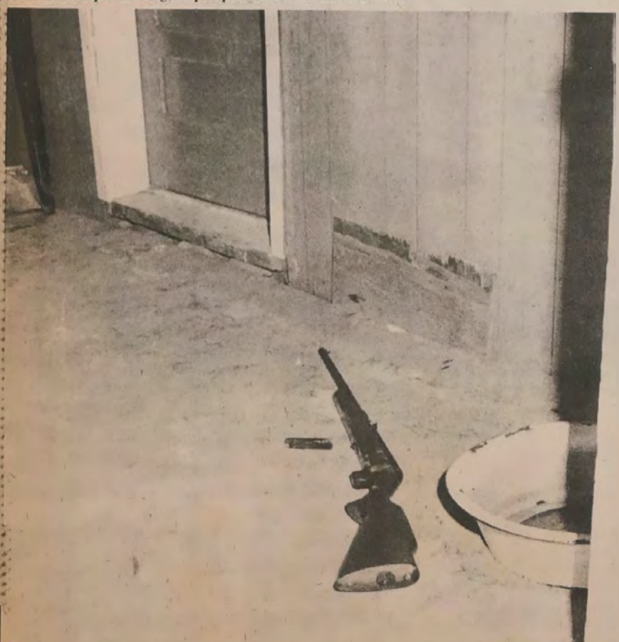
Mar à Pirois coups de feu dont l'un a touché mortellement Roger Croteau, provenaient présumés à vit de cette arme, calibre .22, semi-automatique, tique