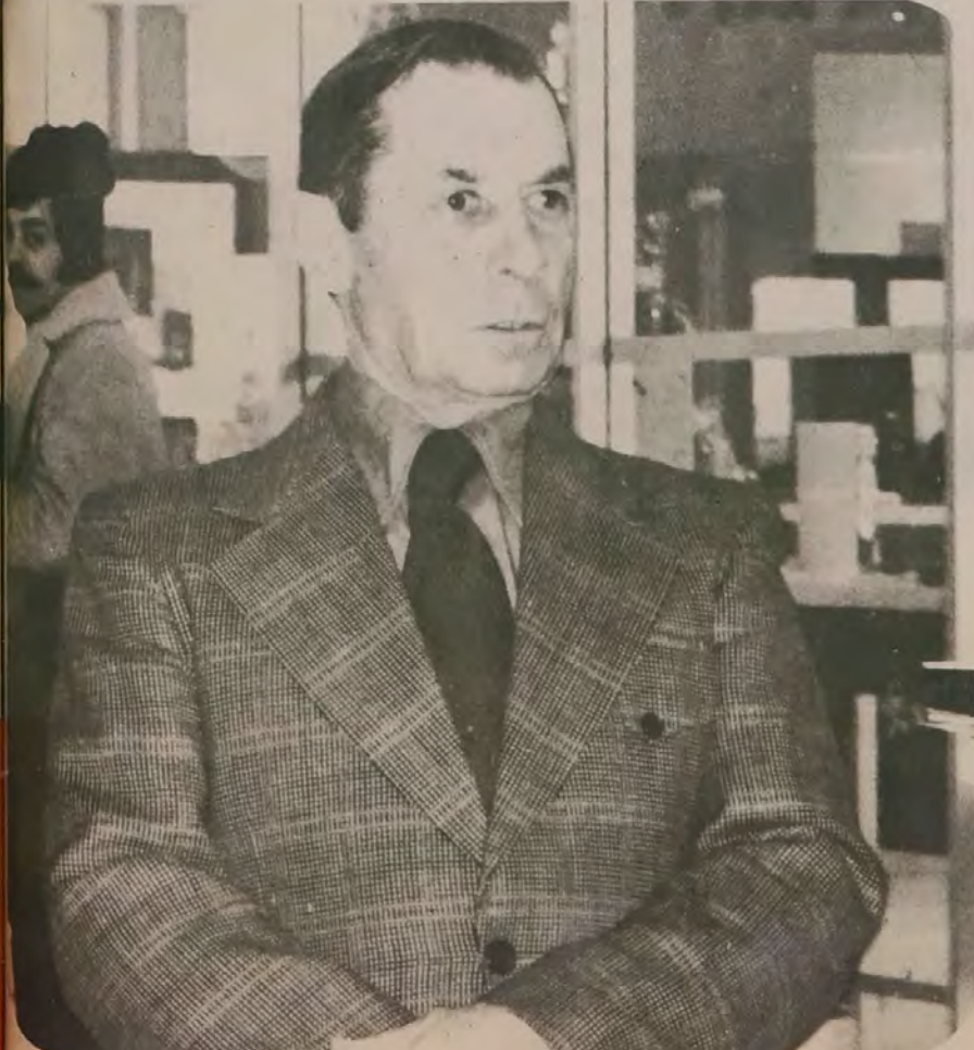
Aucun investissement, aucun voyage, mais bien un dépôt à la banque pour les vieux jours... Voilà donc le projet de M. Lafleur.