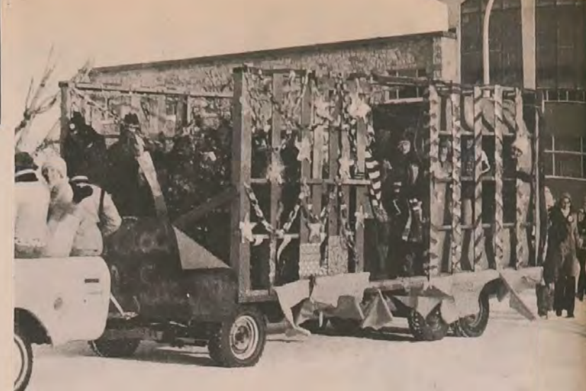
Defiant le froid, les étudiants du Collège St-Bernard ont fêté la Noël à leur façon, en organisant une parade «monstre». Cette scène se passa le 19 décembre dernier, soit quelques heures avant l'ouverture des écoles.

Au moment de sa libération, le bagne de Poulo Condor abritait encore 4.324 détenus, hommes et femmes. Le comité révolutionnaire de l'île a ensuite pris les décisions suivantes: 1) abolir le pouvoir réactionnaire et tout son système d'oppression dans l'île; 2) les officiers et soldats de l'armée fantoche doivent se faire enregistrer et livrer toutes leurs armes; 3) saluer les officiers et soldats mutins; 4) donner l'avertissement et arrêter un certain nombre de détenus de haut commun qui avaient profité du désordre pour piller les biens des familles de soldats dans l'île.