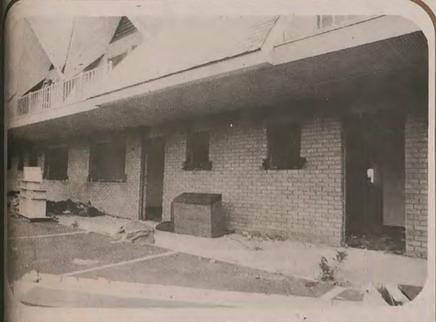
L'aile du motel Albatros qui était restée intacte à la suite de l'incendie de l'an dernier, sera éventuellement déplacée à l'arrière du site, à l'endroit où on se propose de reconstruire le motel.