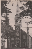
SAINT-PIERRE (1906) L'AVENIR