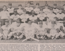
LES MEMBRES DU SPORT