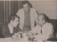
LA SÉRIE DES BILLYS DE BILLYS chez les Rogues fut son plus. Les premiers sont déjà à l'heure de préparer pour ce week-end...