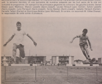
DES ATHLÈTES EN HERBE. Comme dans les années précédentes...