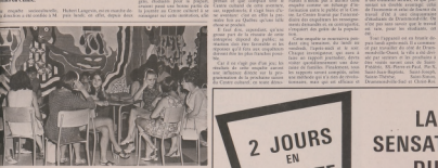
GRUPE D'ENQUÊTES Les Requis de Drummondville ont obtenu une excellente tenue dans une récente compétition.

Une enquête socio-culturelle est en marche. Les Requis de Drummondville ont obtenu une excellente tenue dans une récente compétition.