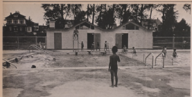
C'EST NOTRE PISCINE

Ce petit bief d'histoire au premier plan de notre photo sert de bain à l'été. Les baigneurs ne sont pas nombreux, mais ils ont leur plaisir. Les enfants y jouent et les adultes y font un tour de piscine.