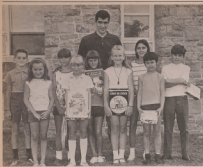
DES JEUNES ARTISTES. Plus de 1500 parents ont assisté à la soirée...