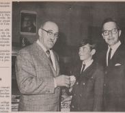
LA CARTE ET LA CAISSE (Caption describing the group above)

Un acte de foi, un acte de courage, un acte de foi, un acte de courage... (Text continues)