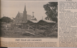
Prêt pour les vacances