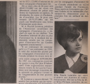
COLLÈGE SACRÉ-CŒUR DRUMMONDVILLE (Caption describing the girl above)

Un acte de foi, un acte de courage, un acte de foi, un acte de courage... (Text continues)