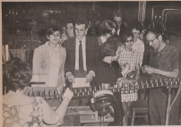
Un groupe qui fait la fête de l'Association des parents de l'école primaire de Drummondville...