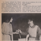
RÉPÉTITION DE THÉÂTRE Pour assister à la répétition de la pièce 'Lady Godiva'...