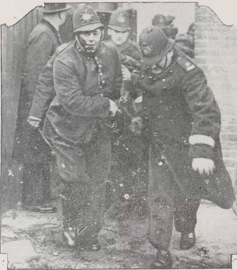
Les constables de la force métropolitaine de Londres sont ici aux prises avec une foule de femmes qui sympathisent avec les démonstrations. L'un des policiers semble être frappé au visage par un objet solide. Au cours du fracas, la dame fit descendre de sa fenêtre par un câble. La police eut de la difficulté à rétablir l'ordre.