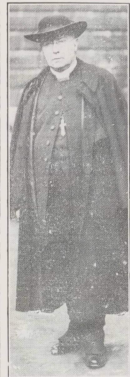
Le cardinal Francis Bourne, primat de l'Eglise Catholique Romaine en Angleterre qui est présentement à la dernière extrémité. On n'espère plus sa guérison. Les derniers sacrements lui ont été administrés.