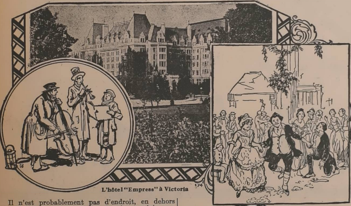
L'hôtel "Empress" à Victoria

Il n'est probablement pas d'endroit, en dehors des Iles Britanniques, qui soit plus anglais que Victoria, la coquette capitale de la Colombie Britannique, siée à l'extrémité sud de l'île Vancouver. La langue et la mentalité de la population de Victoria sont anglaises, le style des constructions est largement anglais, le climat et la végétation sont à peu près les mêmes que ceux de la vieille Angleterre. Cette année Victoria célèbrera la fête de Noël d'une façon toute spéciale et ce sera à la mode anglaise. Le Festival de Noël qui fera revivre les anciennes coutumes, la musique et les chants de Noël dont s'égayait autrefois la population anglaise à l'occasion de la grande fête de la Nativité de Jésus. Ce Festival se prolongera de Noël jusqu'à l'Épiphanie et se déroulera en grande partie dans les luxueux salons de l'hôtel "Empress," que dirige le