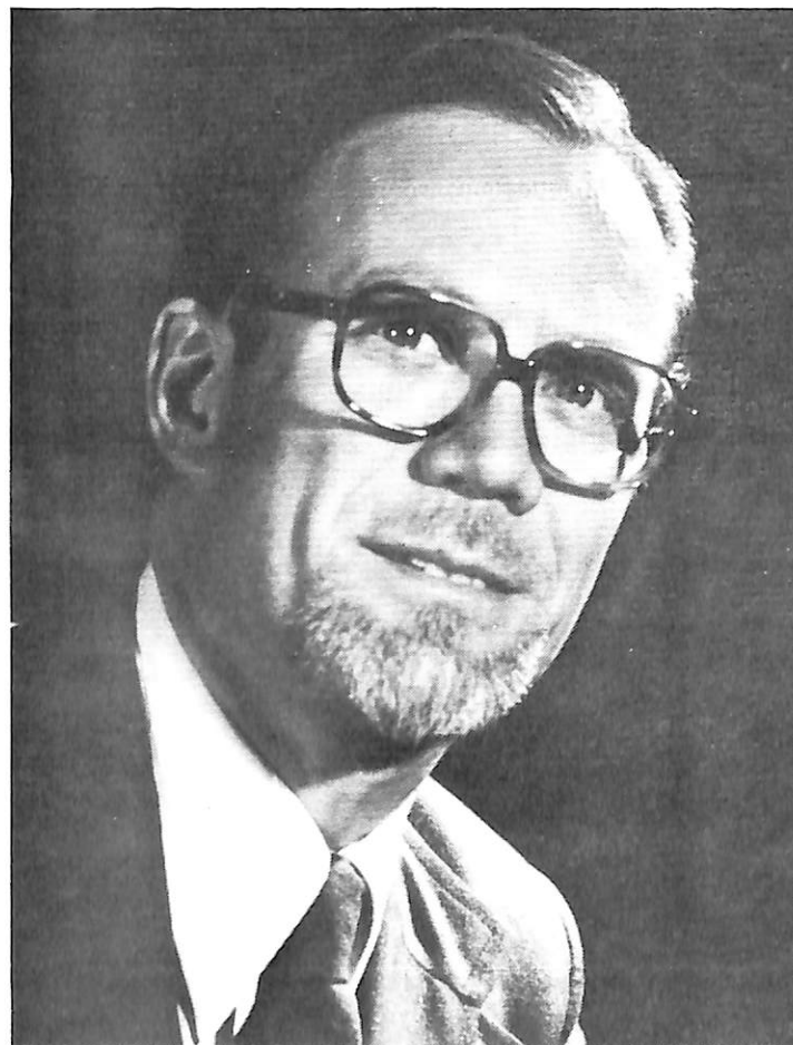
Notes biographiques de M. Jacques-Yvan Morin Député de Sauvé et chef de l'Opposition à l'Assemblée nationale

DÈS MAINTENANT, faites la réservation de vos billets pour ce dîner-causerie mixte en téléphonant au secrétaire de la Chambre de Commerce au numéro 472-5245; nous ferons la livraison avec plaisir.