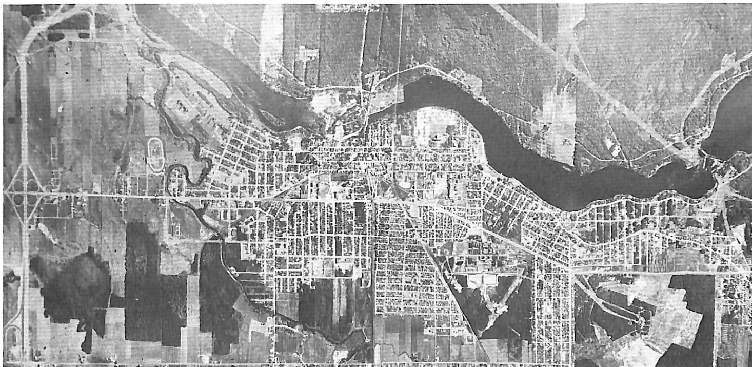
Photo aérienne de la Cité de Drummondville. Les intéressés peuvent s'en procurer au secrétariat de la Chambre de Commerce au prix de $3.00 la photo; grandeur 8''x 20''.